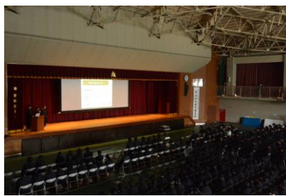
科学部による科学研究発表