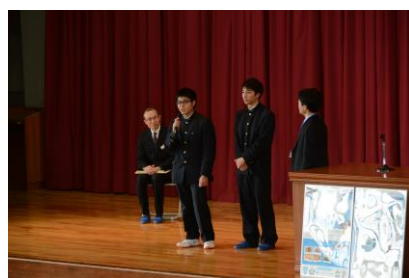
広島湾再生プロジェクト紹介