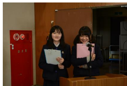
生徒企画委員会「プロジェクトK」