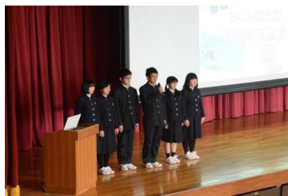
国際科学交流報告