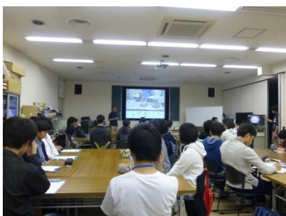
マイクロプラスチックの講義