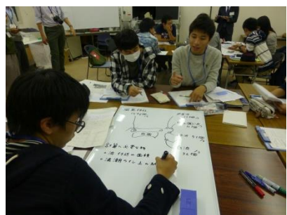
調査内容のディスカッション