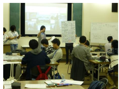
プレゼンテーション