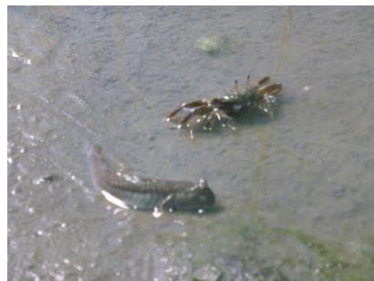
生態系の物質循環について考える