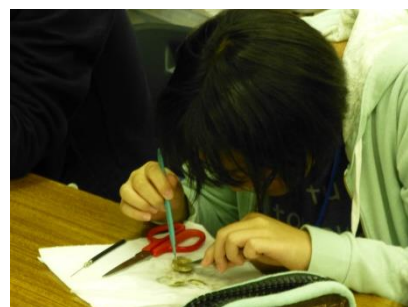
アサリに取り込まれたプランクトンの観察