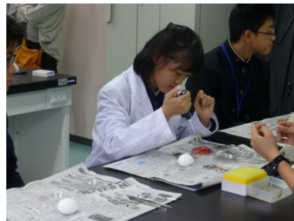
DNA鑑定のために血液を採取