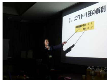
プレゼンテーション