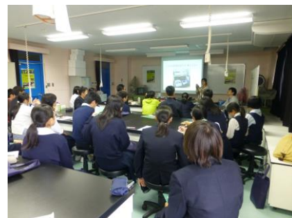
TAさんからPCRの説明を受けました