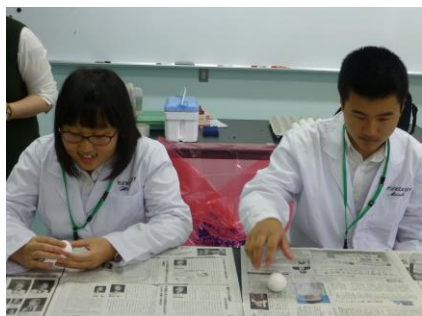
有精卵の観察を開始

10月23日（日）に理数ゼミ生物班1年生が、広島大学生物生産学部での「この肉，卵はオスなの，メスなのか～DNA鑑定でお肉や卵の雌雄を診る～」に参加してきました。大学で行われている最先端の研究成果の一端を，直に見る，聞く，触れることで，科学のおもしろさを感じました。