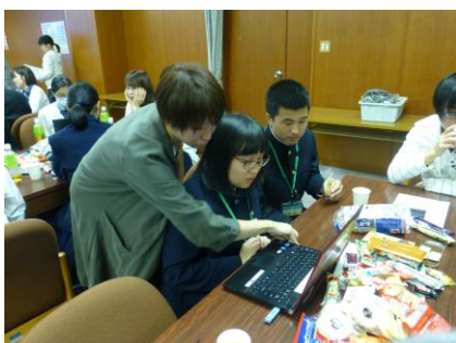
パワーポイントでプレゼン準備