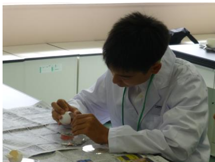
卵から胚を取り出します