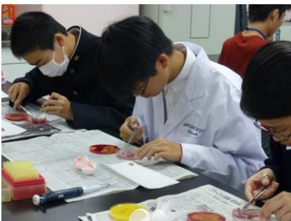
胚の形態による雌雄の判定