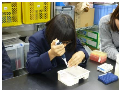
DNAをウエルの中へ！緊張の瞬間！