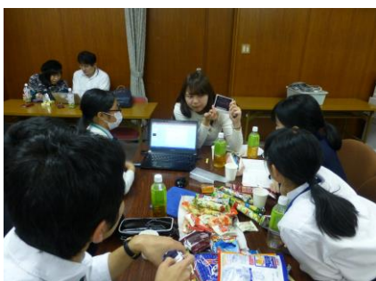
白熱のディスカッション