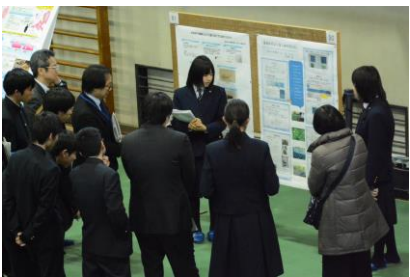
安田女子高校の発表