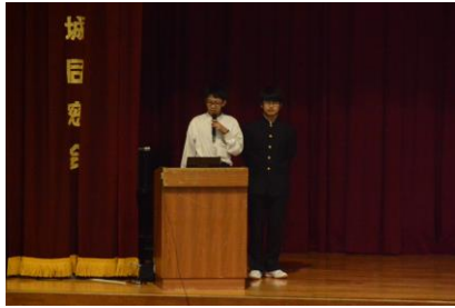
ソリューション班