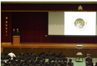
国際学会発表報告