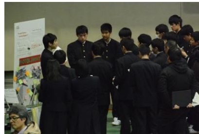
広島創生イノベーションスクール報告