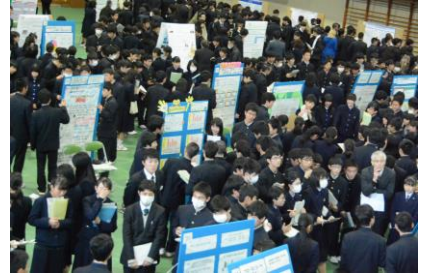
ポスターセッション