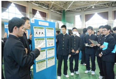
ポスターセッション