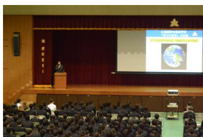
「学びの変革」取組報告