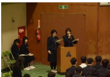
日本語と英語による司会