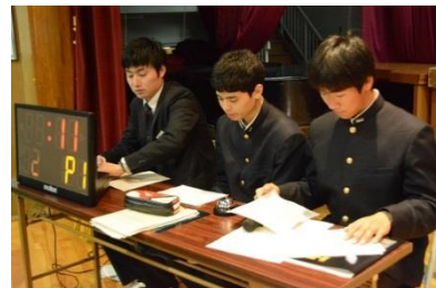
進行もバイリンガル