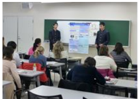
研究発表・質疑応答