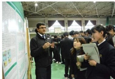
BCA校の生徒による発表（英語）