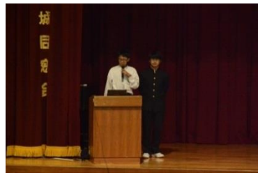
ソリューション班