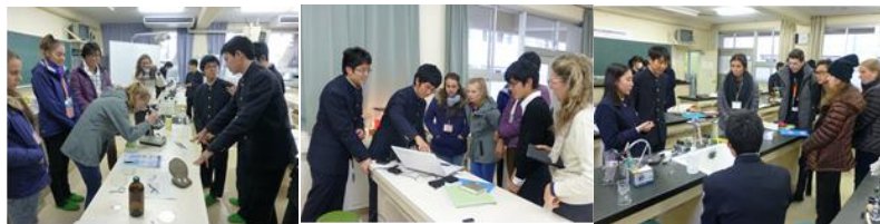
2年エクспロアリングサイエンス (EPS) に参加