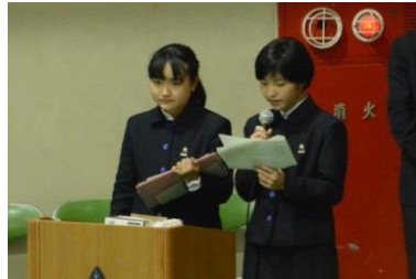
午後も日本語と英語による司会