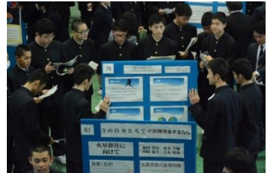
ポスターセッション