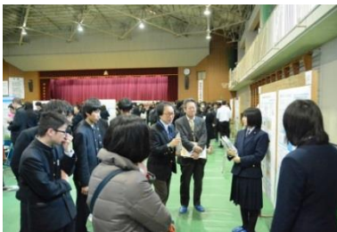
大学の先生からの質問