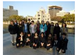
<宮島散策・平和公園訪問>