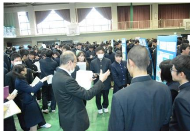
校長先生も質疑に参加！