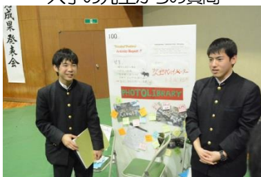
広島創生イノベーションリポート