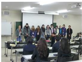
オーストラリアの高校生