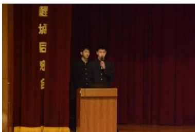
国際研究報告(生物班)