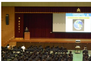
「学びの変革」取組報告